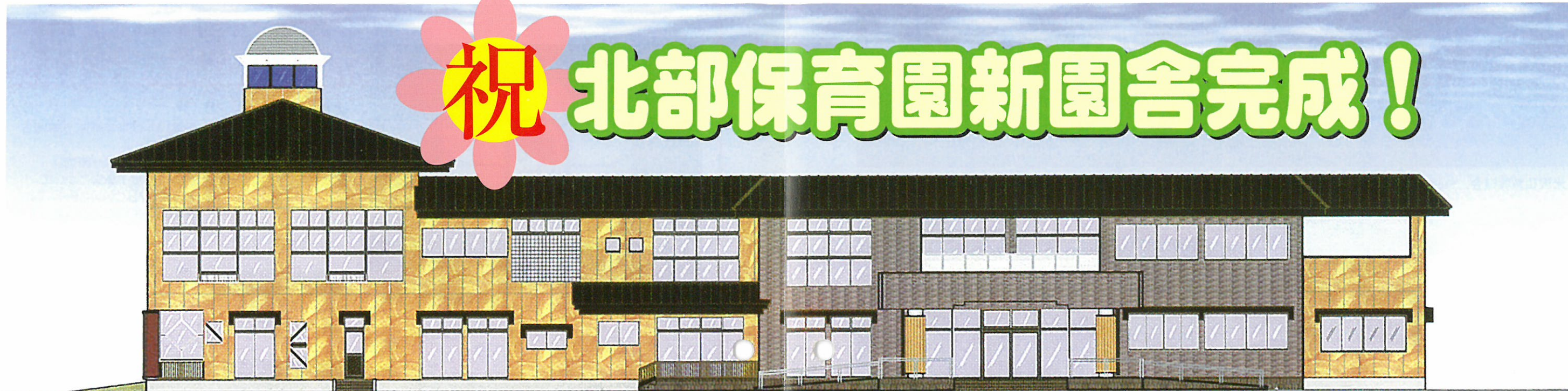
興道北部保育園 新園舎イメージ