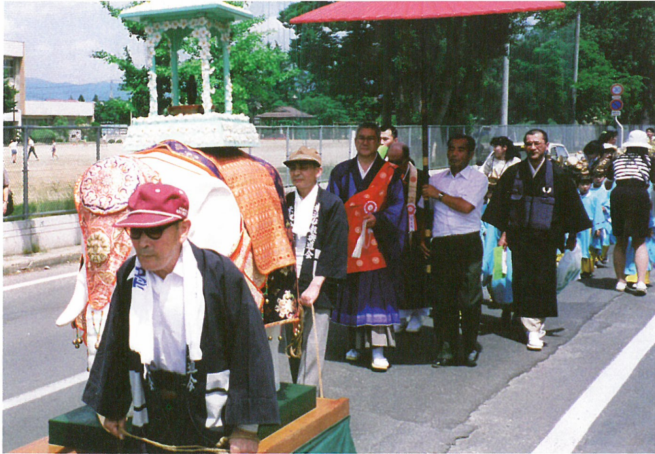
花まつり稚児行列から

米沢仏教興道会 〒992-1443 米沢市大字笹野170番地 花の里内 TEL0238-38-3328 FAX0238-38-2198 発行責任者/ 玉木龍晃