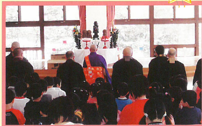
園児の安全祈願祭

旧園舎から新園舎への引越に伴い、子供達の更なる健やかな成長を願い、安全祈願祭を三月八日に行いました。