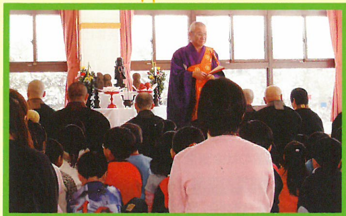
会長からのお話風景