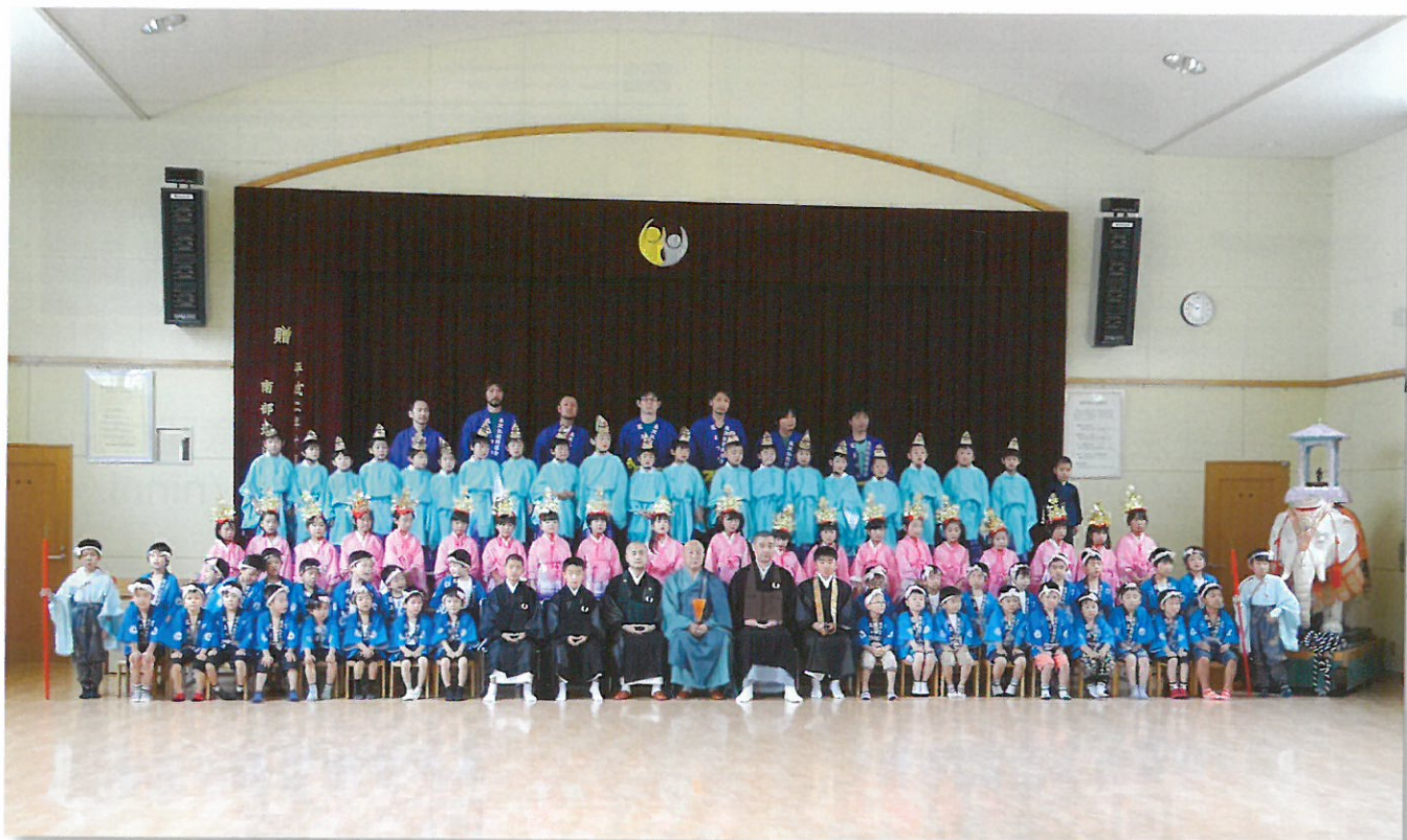
第90回花まつり 稚児行列 集合写真

米沢仏教興道会 〒992-0042 米沢市塩井町塩野1476-1 興道北部保育園内 TEL0238-40-0044 FAX0238-37-8399 発行責任者/熊野龍雄